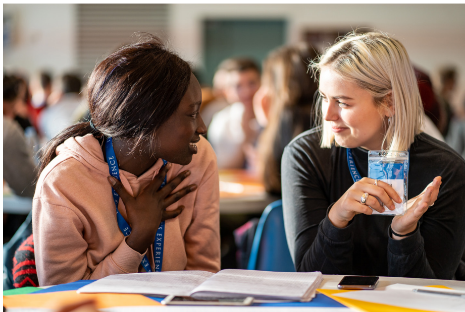
Workshop Estetica del lavoro 23-01-2020

Grazie infatti al profondo legame con il mondo delle aziende, oltre il 95% degli studenti ottiene un contratto di lavoro entro la fine del percorso.