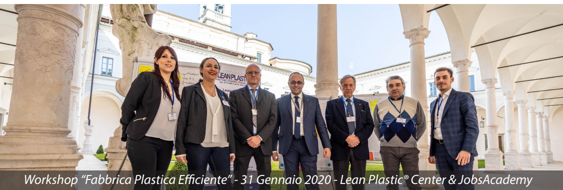
Workshop "Fabbrica Plastica Efficiente" - 31 Gennaio 2020 - Lean Plastic® Center & JobsAcademy

In JAC tutto ha la forma dell'impresa. Dalla didattica pratica al sostegno di start-up nate dall'intuito degli studenti. Un risultato frutto della partnership stretta con primarie società nazionali e internazionali del mondo dei servizi, dell'industria e della tecnologia.